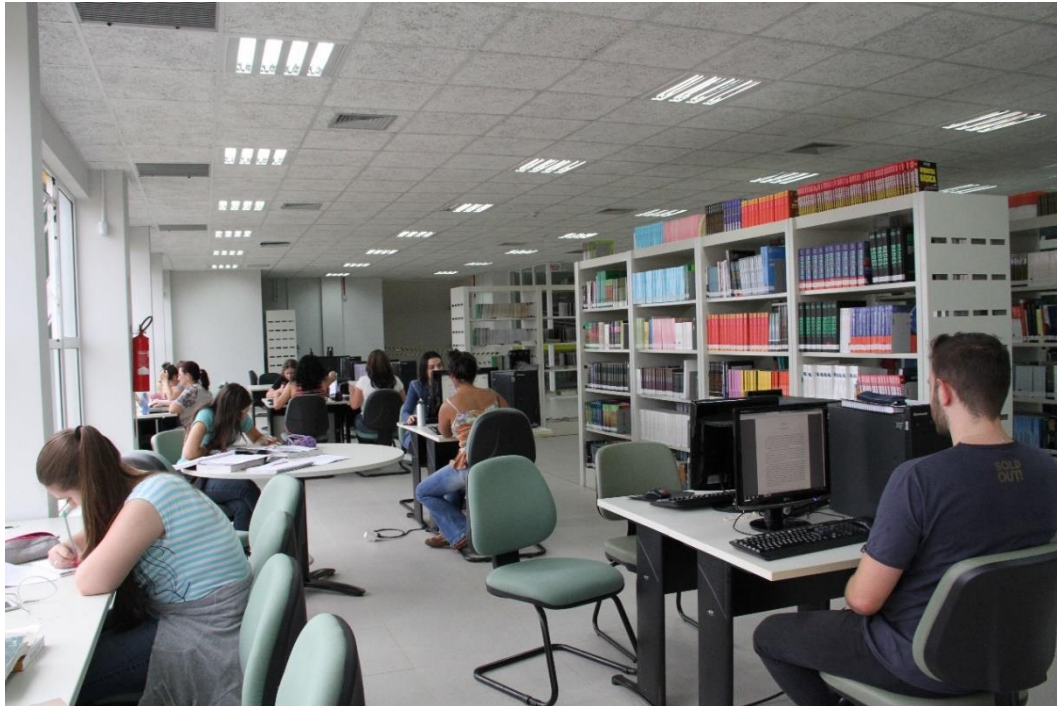
Figura 1 – Biblioteca

As figuras devem ser apresentadas conforme exemplo da